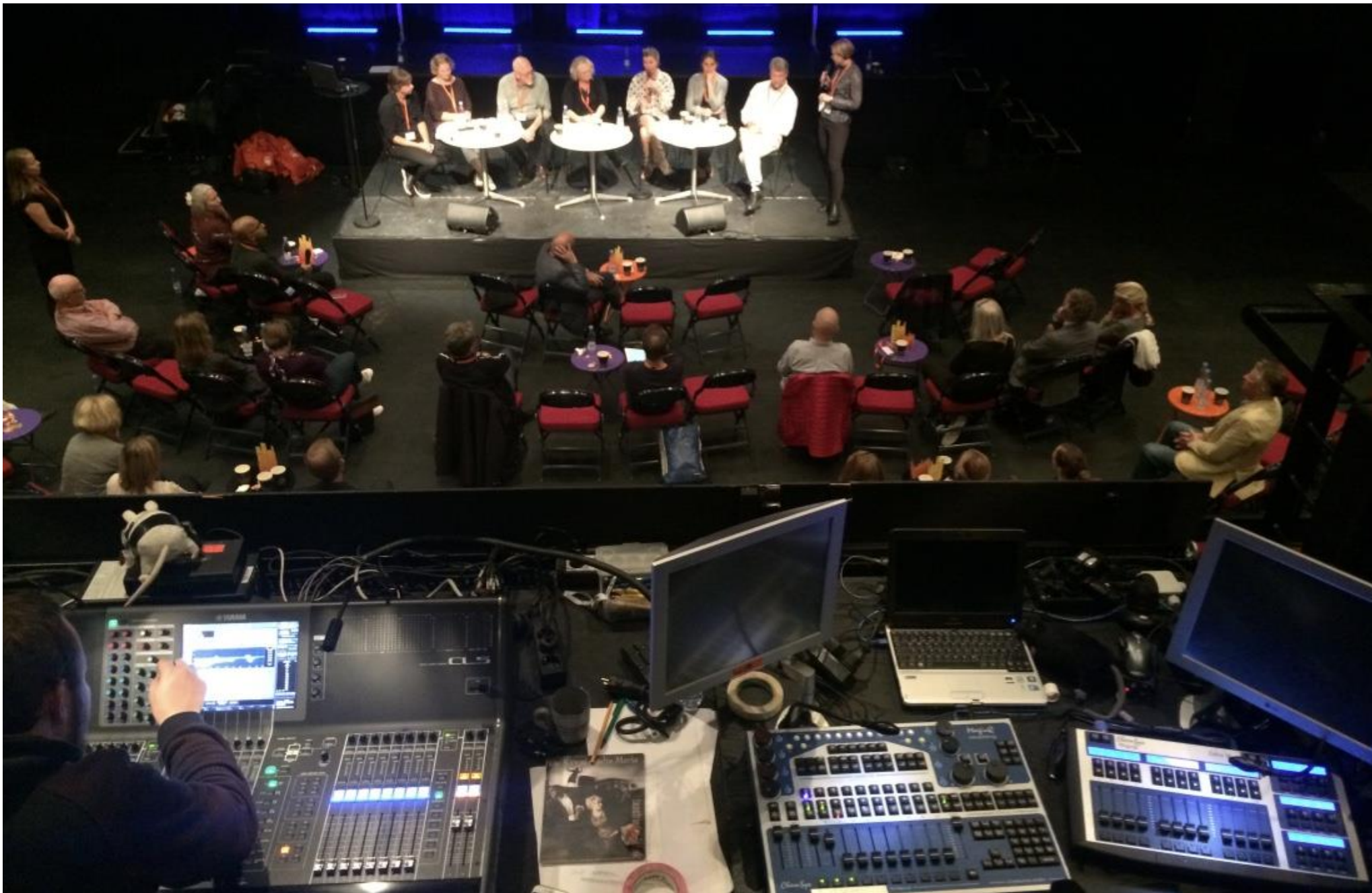
Udsigten fra kontrolrummet.