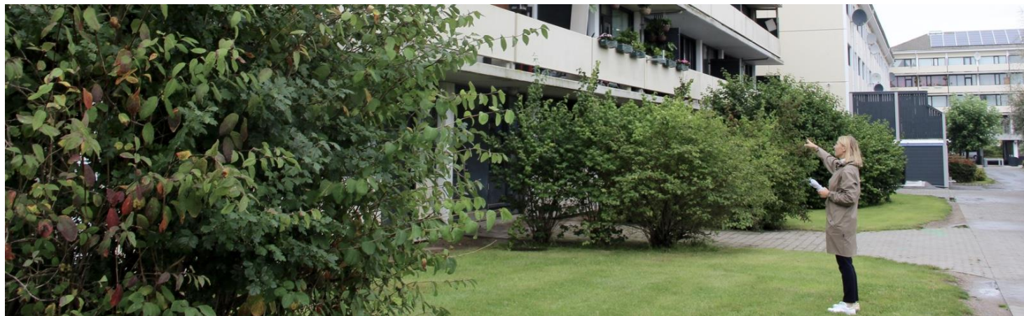
På vandring gennem det udsatte bolig- område Taastrupgård, som gennemgår et omfattende fornyelses- og inklusionsprojekt.